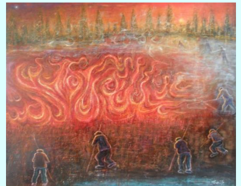
野 焼 き